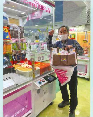
ゲームセンターに行きたい！！

それぞれ職員が同行し、個別レクとして外出をしました！利用者様には、生き生きとした表情が見られました。今後もデイサービス木かげでは利用者様に対し様々な方向からアプローチをはかりレクリエーションに取り組んでいきます。