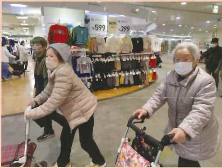
買い物に行きたい！！

デイサービス木かげでは虹の会10の基本ケアをもとに理念である「高齢者や障がいのある方が、その人らしい生活ができるよう援助する」を実践しています。今年から茶話会を定期的を開催し、いろいろな意見や要望を利用者様より直接聞いて実現できるようにしております！！