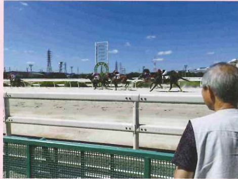
競馬の観戦に行きたい！！